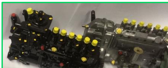
Einspritzpumpenreparatur und –umbau auf Anfrage